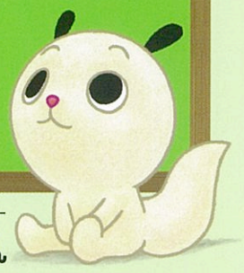
NHK-BSキャラクター ななみちゃん

ケーブルテレビを通して衛星放送(BS)が受信できる場合、NHK衛星契約が必要です